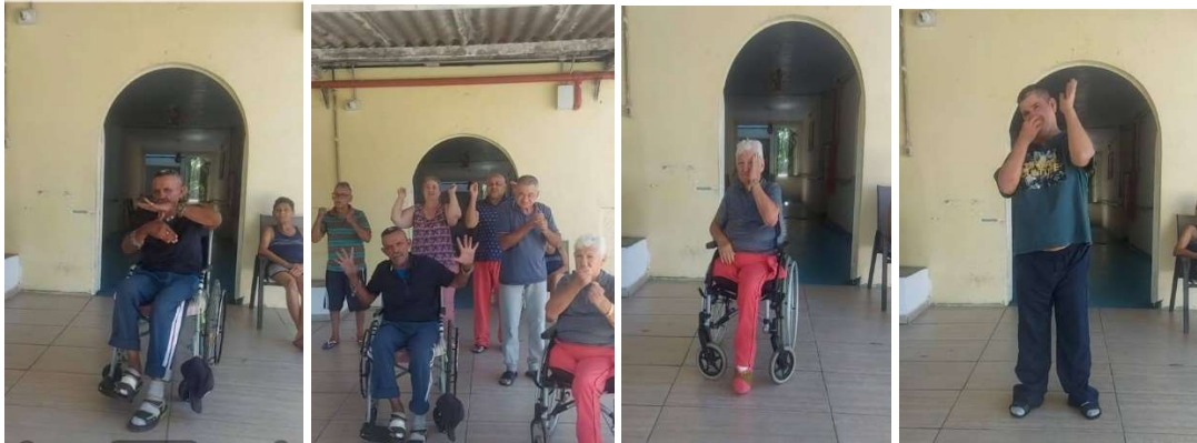
Atividade Movimentando-se no Tik Tok- 26/01/2023