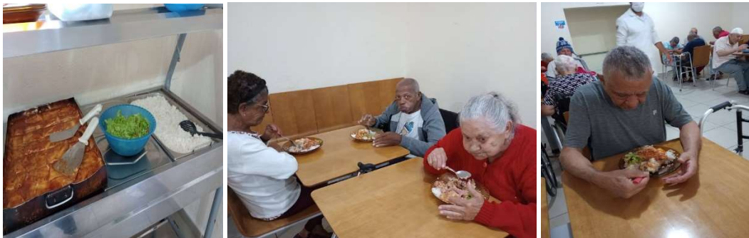
Ação Almoço de Ano Novo-01/01/2023