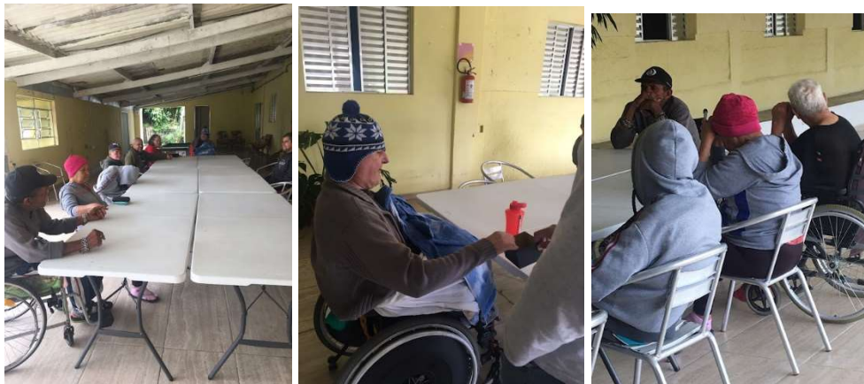
Atividade Inter-Religioso -20/01/2023