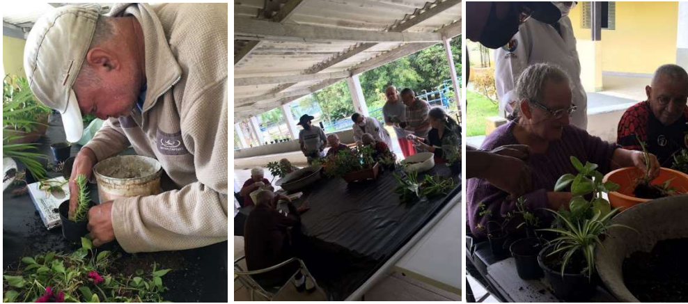
Atividade Jardinagem -30/01/2023