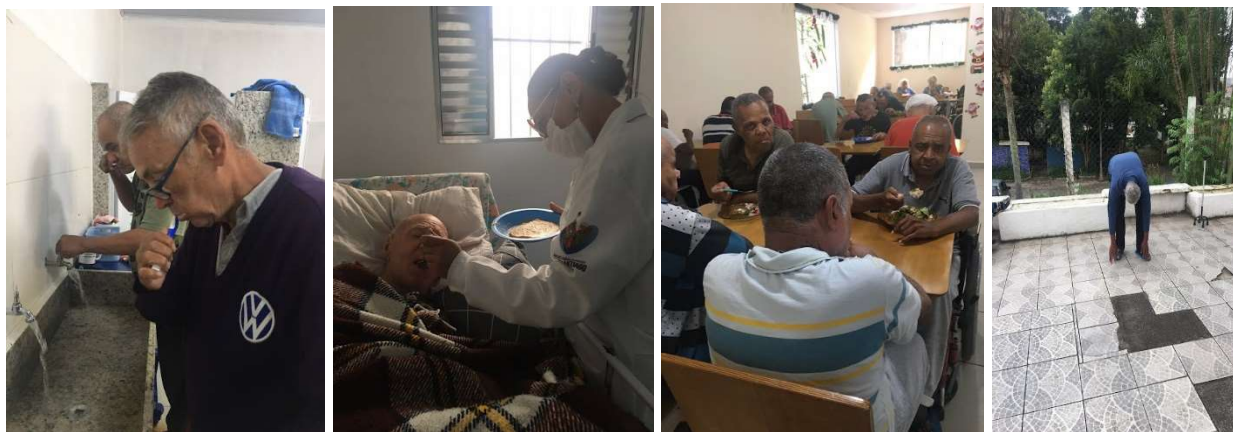
Atividades de vida diária- 01/01/2023 a 31/01/2023