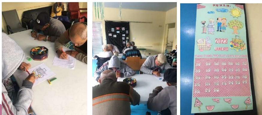
Atividade Calendário Do Mês -03/01/2023