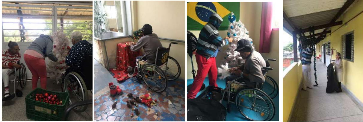
Atividade Guardando os enfeites (área interna e externa) – 05/01/2023 e 06/01/2023