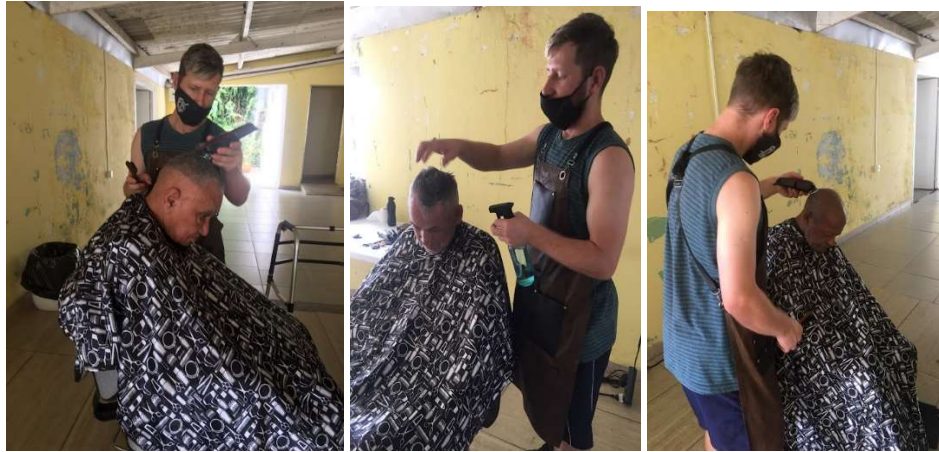
Ação Dia da Beleza:23/01/2023