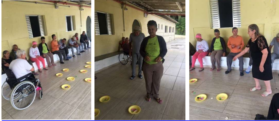
Atividade Vegetais X Frutas -12/01/2023