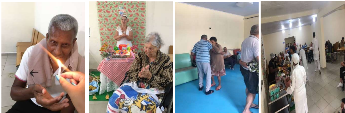
Ação Aniversariantes do mês -31/01/2023