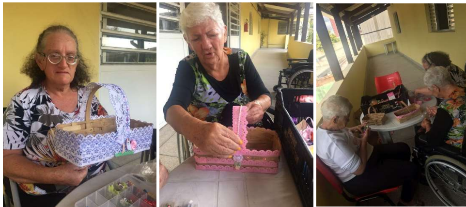
Atividade Artesanato de cestas-27/01/2023