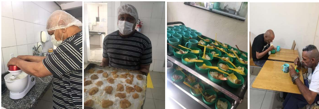
Atividade Culinária-Torta de Pêssego -25/01/2023