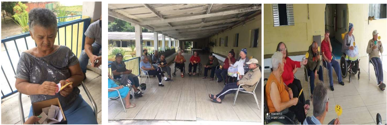
Atividade Dia do Riso – 19/01/2023