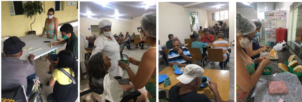
Ação Visita Social com Grupo Paulo de Tarso 28/01/2023