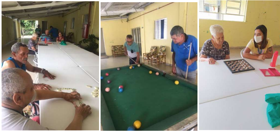
Atividade Dia do jogo limpo 16/01/2023