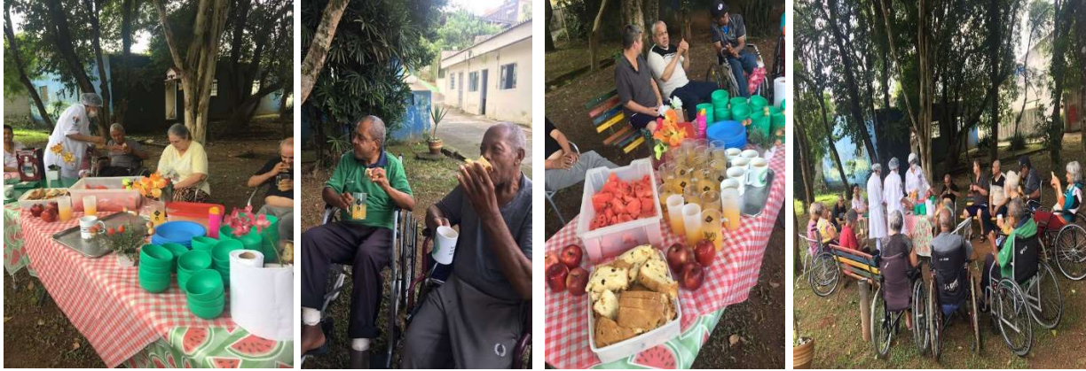
Ação: Piquenique no Jardim-17/01/2023