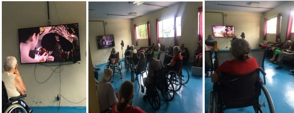
Atividade –Cine Soler: Branca de Neve-24/01/2023