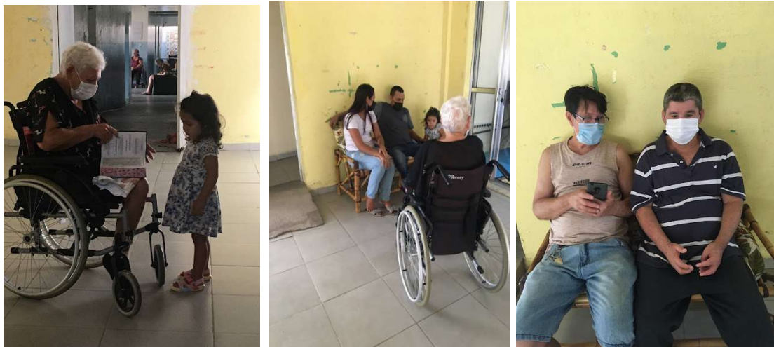
Visitas familiares presencial -01/01/2023 a 31/01/2023