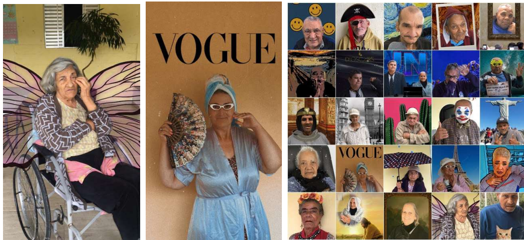
Atividade Dia do Fotógrafo – 09/01/2023