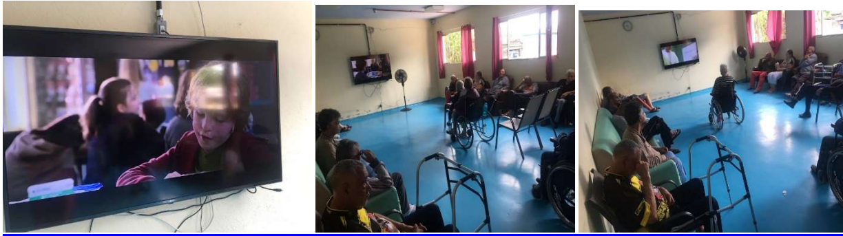
Atividade Cine Soler: Extraordinário 13/01/2023